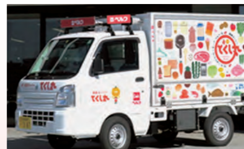
▲移動販売「とくし丸」の車 市内各所で活動しています。

そんな中、伊勢崎市と市内でスーパーマーケットを経営する民間企業が地域見守り活動に関する協定を結び、軽自動車に商品を載せてご自宅等を訪問する移動販売事業が始められました。